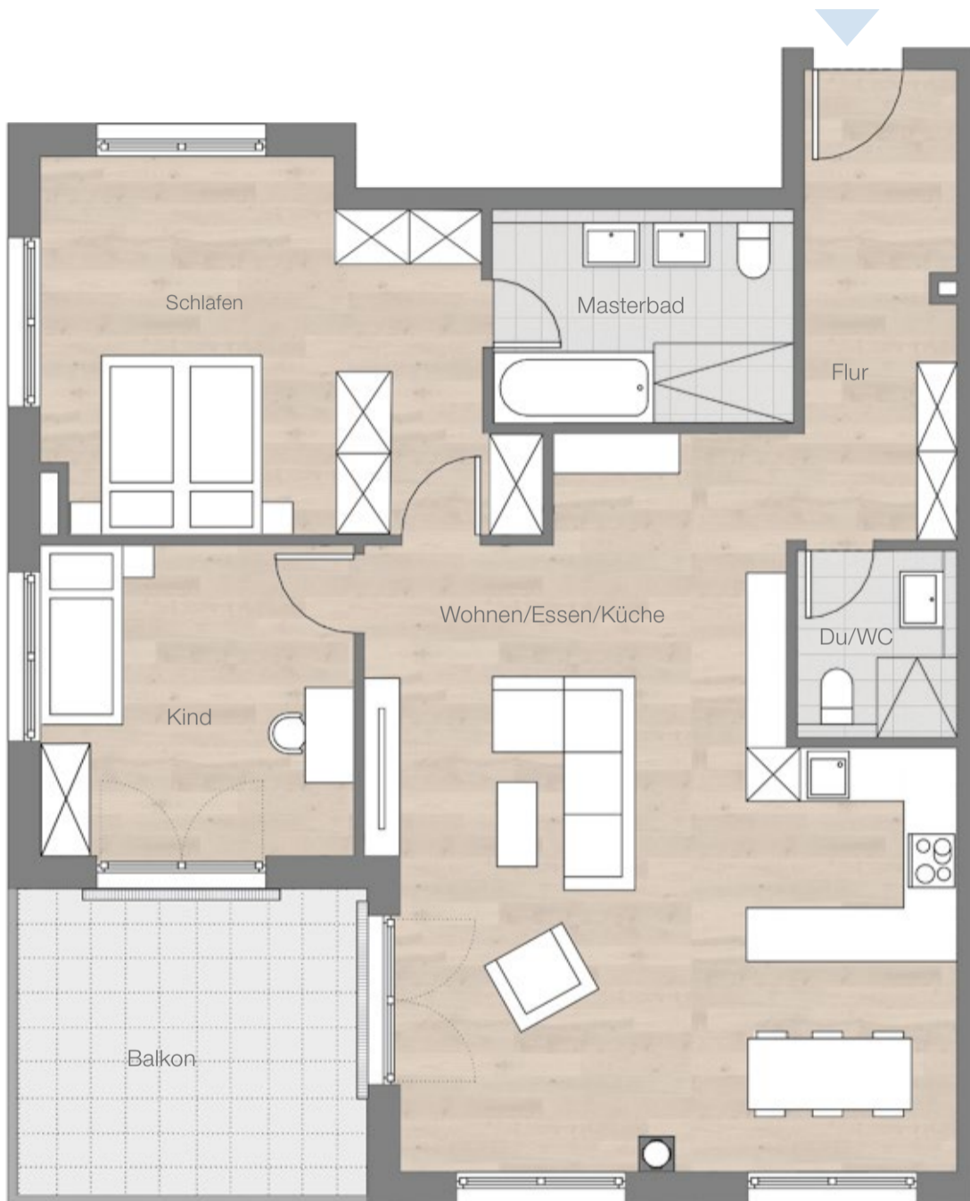
Maßstab ca. 1:75